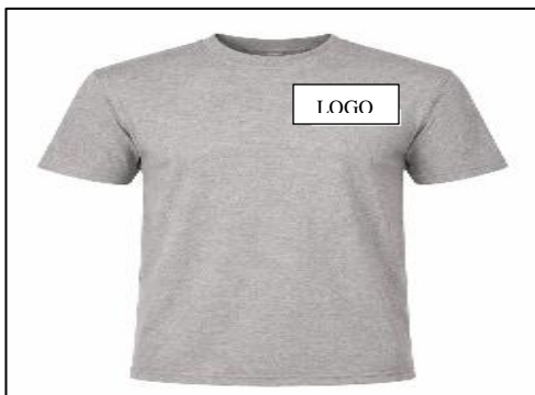
Ilustración 3 Polo manga corta