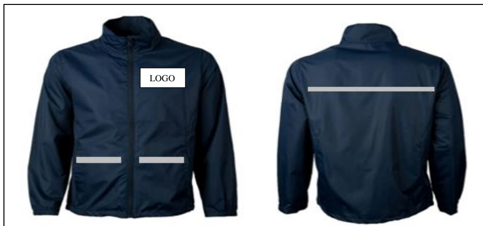
Ilustración 4: Cascas cortaviento con cintas reflectivas