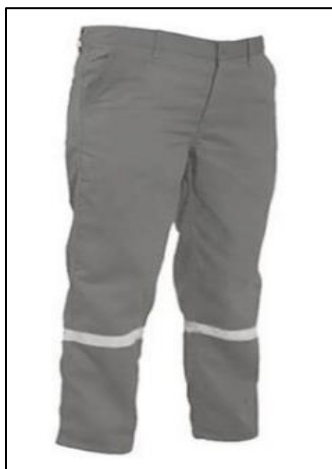
Ilustración 1: Imagen referencial de Pantalón Industrial