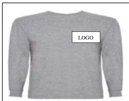
Ilustración 2: Polo manga larga